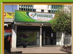
AGENCIA RAMADA Av. Grigotá, #541, Zona Mercado La Ramada Telf: 353-2986