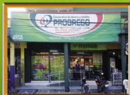
AGENCIA MERCADO EL TORNO Av. República, Freno del Mdo. Central El Torno. Trif: 382-2205