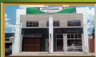
AGENCIA MAIRANA Av. Avaróá, Barrio "La Colonia" #11 Telf: 948-2355