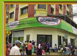
AGENCIA ABASTO Av. Roque Aguilera, 3° Anillo Int. Z/Mdo. Abasto, B/Cooper #3670 Telf: 359-9572