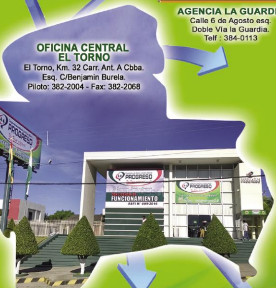
OFICINA CENTRAL EL TORNO El Torno, Km. 32 Carr. Ant. A Cbba. Esq. C/Benjamin Burela. Píloto: 382-2004 - Fax: 382-2068