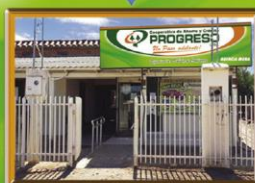
AGENCIA MORA Loc. Francisco Mora, Km. 82 Carr. A Camiri Telf: 763-45275