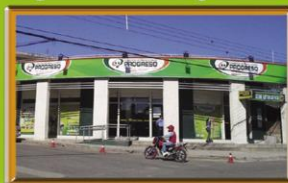
AGENCIA LA GUARDIA Calle 6 de Agosto esq. Doble Vía la Guardia. Telf : 384-0113